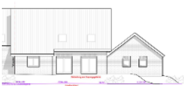
Haus Hausnummer 55