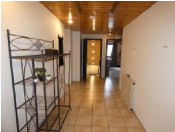
Flur im DG