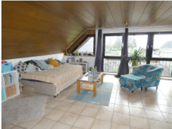
gr. Wohn-/Schlafraum im DG