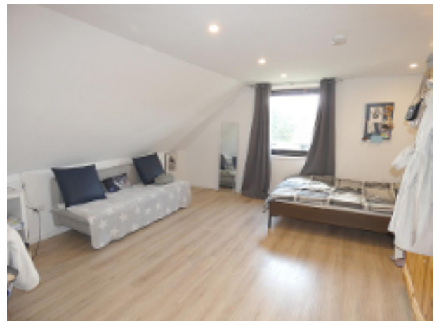
2. Kinderzimmer im DG