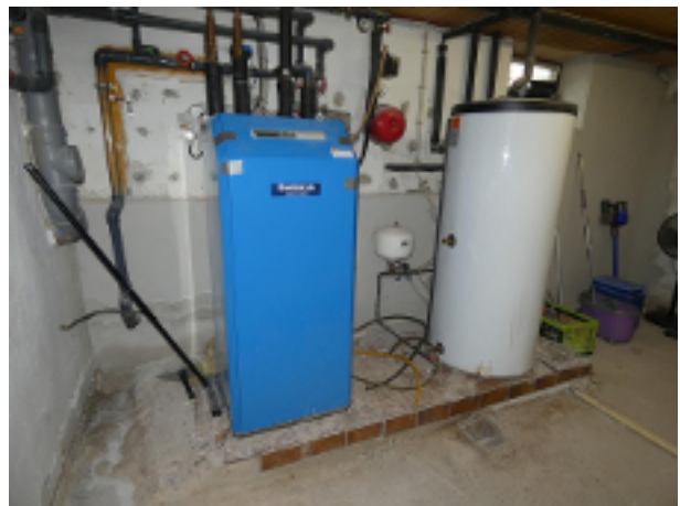
Heizung im Keller