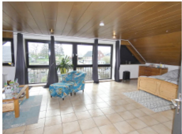
gr. Wohn-/Schlafraum im DG