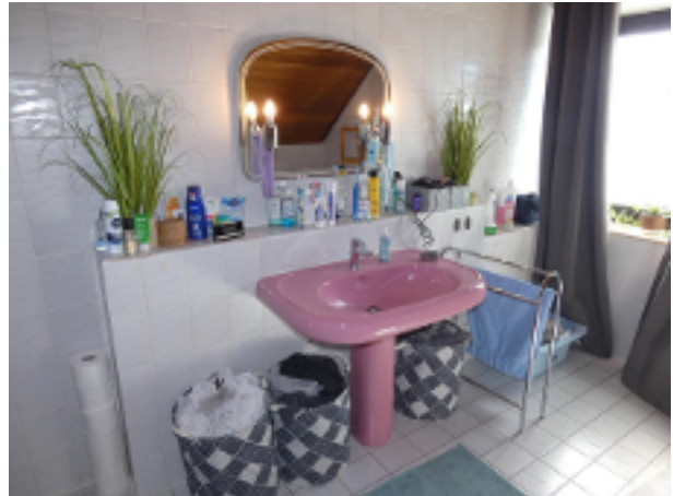
Bad im DG