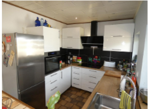
Küche im EG