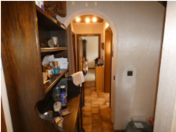
Flur im EG