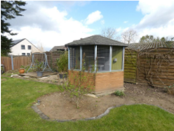
Vogelhaus im Garten