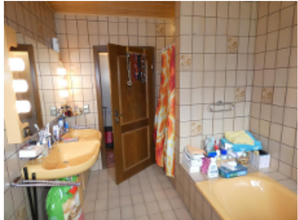
Bad im EG