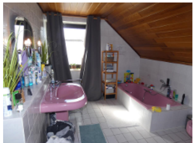
Bad im DG