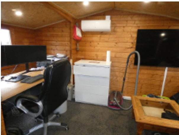
In dem Gartenhaus