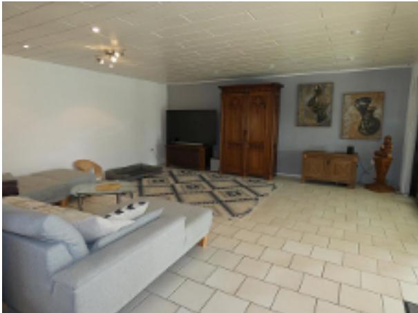
Wohnzimmer im EG