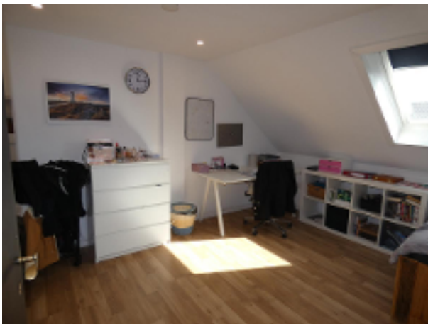
1. Kinderzimmer im DG