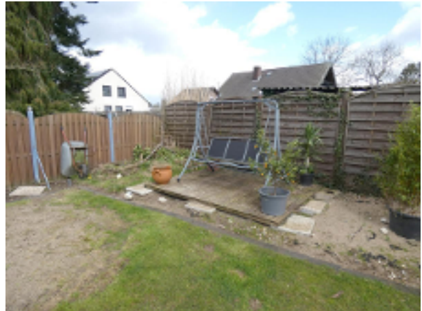
Hollywoodschaukel im Garten