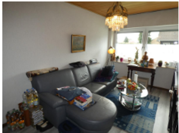
2. WZ oder Schlafzimmer im EG