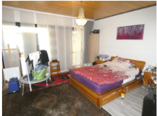
Schlafzimmer im EG