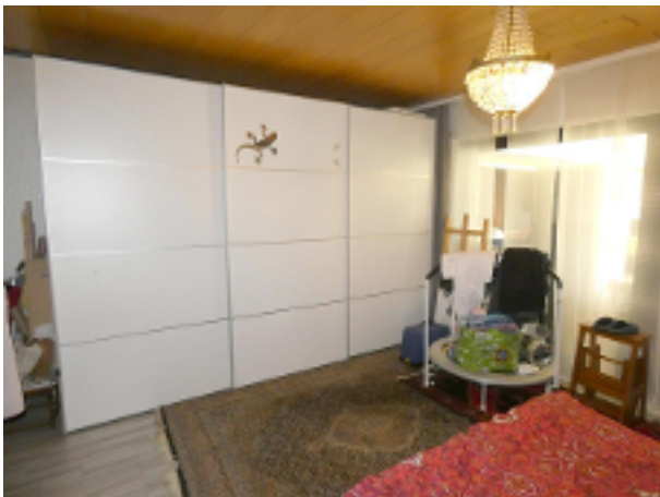
Schlafzimmer im EG