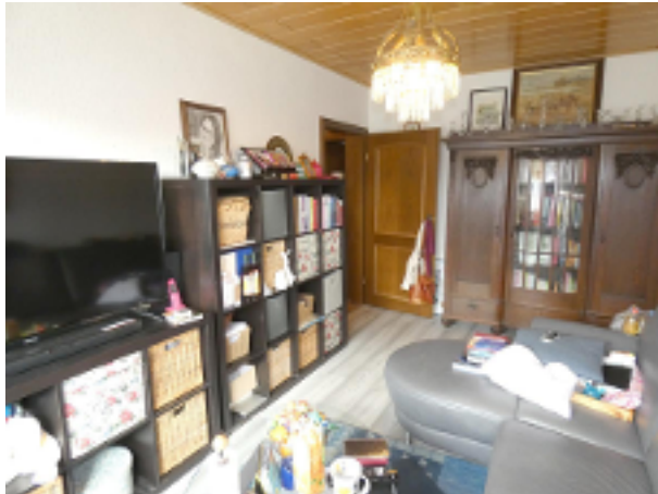
2. WZ oder Schlafzimmer im EG