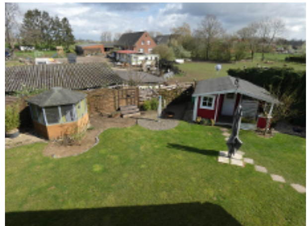
Blick in den Garten