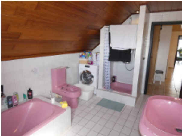
Bad im DG