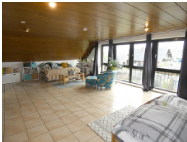
gr. Wohn-/Schlafraum im DG