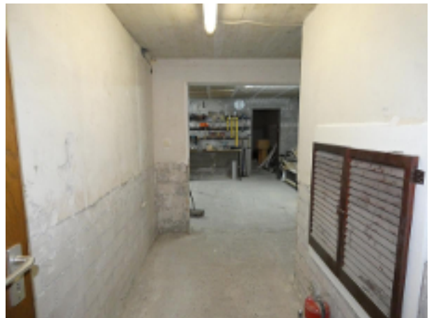
Flur im Keller