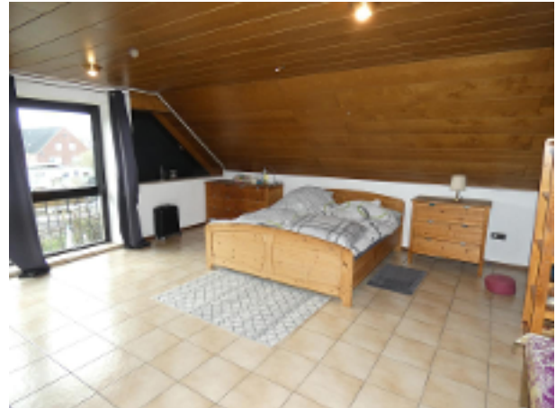
gr. Wohn-/Schlafraum im DG