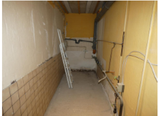
Hausanschlussraum im Keller