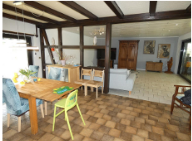
Wohn-/Esszimmer im EG