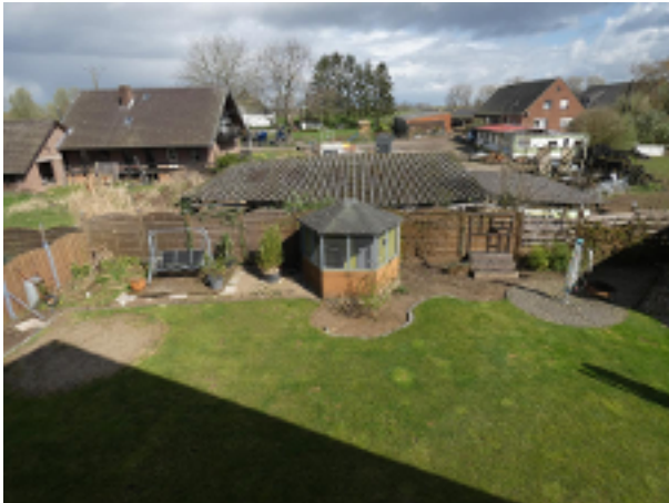
Blick in den Garten