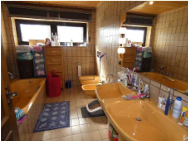
Bad im EG