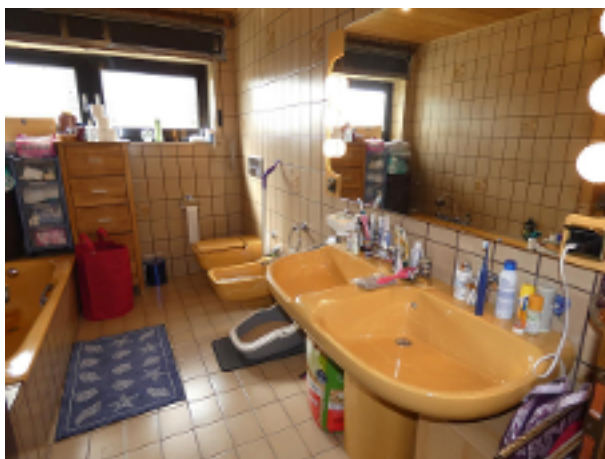
Bad im EG