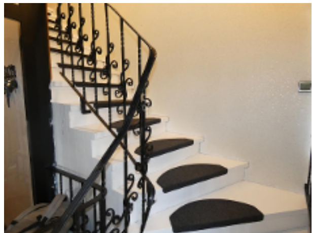
Treppe zum DG