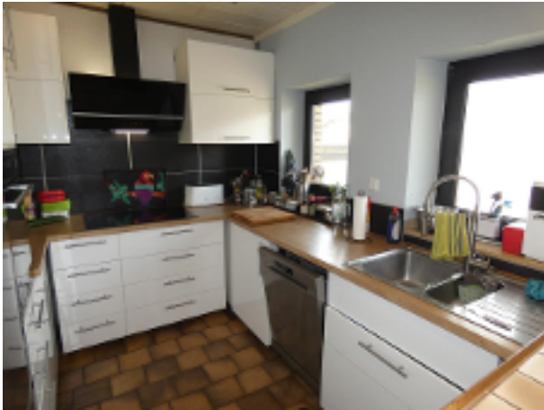
Küche im EG