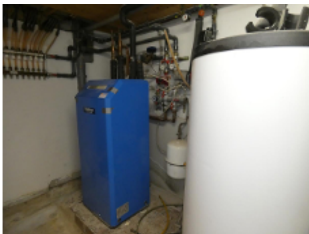
Heizung im Keller