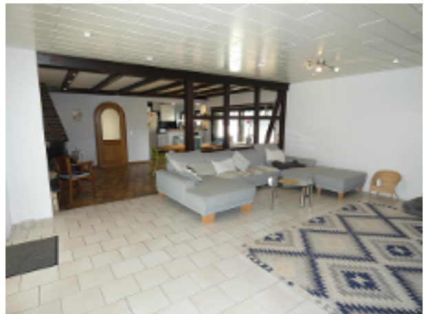
Wohnzimmer im EG