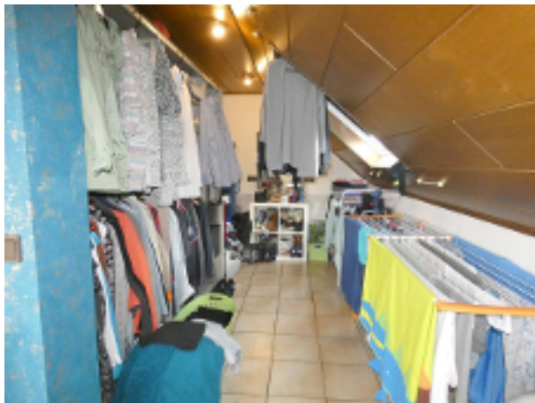
Ankleide im DG