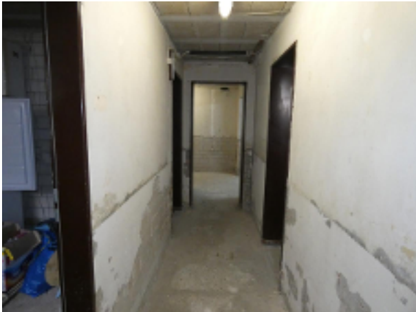
Flur im Keller