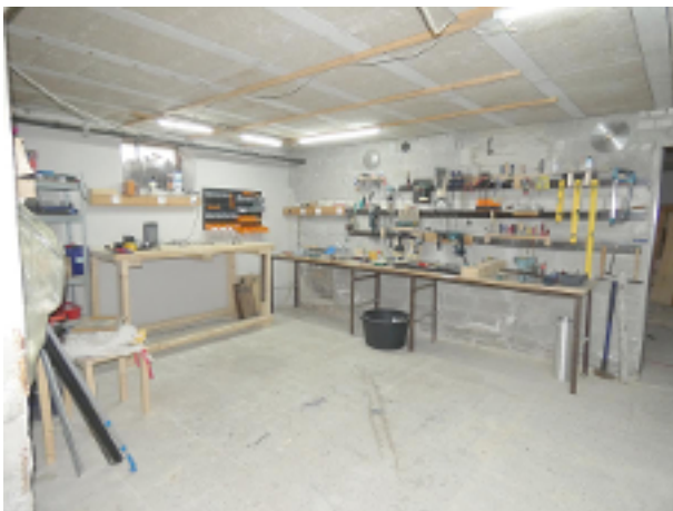
Werkstatt im Keller