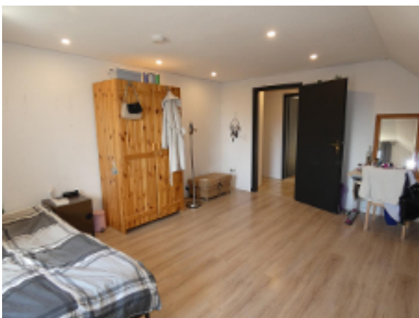
2. Kinderzimmer im DG