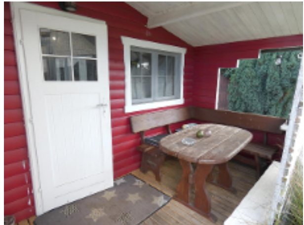
Vor dem Gartenhaus