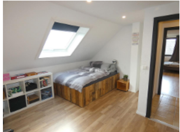
1. Kinderzimmer im DG