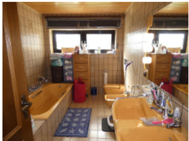
Bad im EG