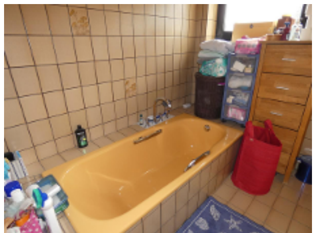
Bad im EG