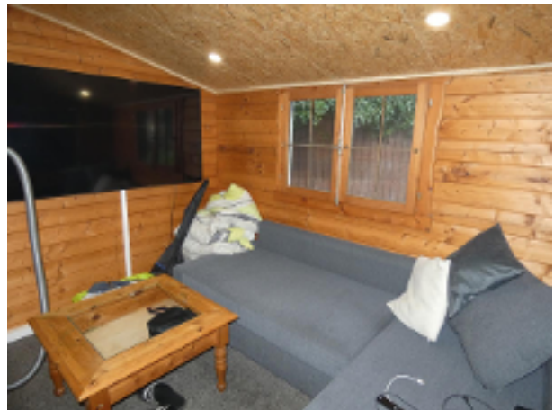
In dem Gartenhaus