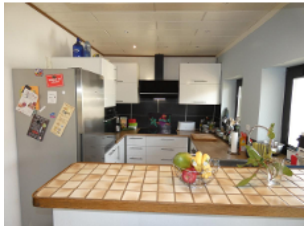
Küche im EG