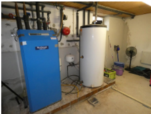
Heizung im Keller