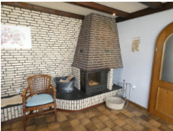
Kamin im EG