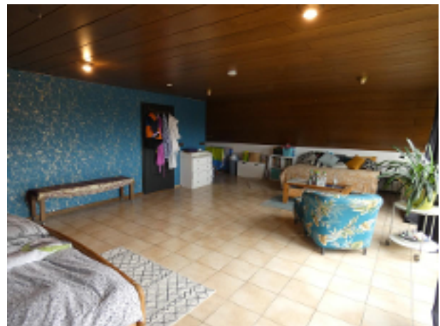
gr. Wohn-/Schlafraum im DG